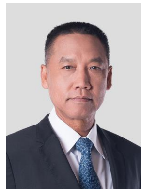
เสนอเป็นกรรมการอิสระ