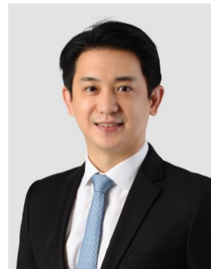
เสนอเป็นกรรมการ